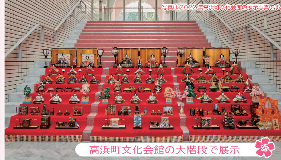
高浜町文化会館の大階段で展示