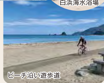
ビーチ沿い遊歩道

高浜町の自慢は、何と言っても透明な美しい海です。海水浴で賑わう夏はもちろん、春と秋も特に海水の透明度が高くおすすめです。若狭和田ビーチは、ビーチの国際環境認証ブルーフラッグをアジアで初めて取得しました。ビーチ沿いには、遊歩道が整備されており、サイクリングにもピッタリ。