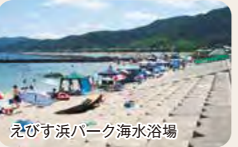
えびす浜パーク海水浴場