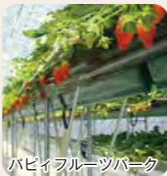
ハピフルフルーツパーク