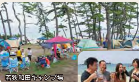
若狭和田キャンプ場

海水浴期間中、浜辺でBBQができる場所や施設があり人気です。地どりの新鮮シーフードがおすすめ。また、高浜町のキャンプ場は、いずれも海辺にあり、色んな遊びが楽しめます。夏季以外も営業しているキャンプ場もありシーズンオフも楽しめます。