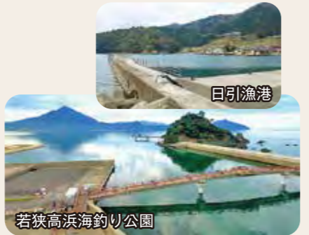
若狭高浜海釣り公園