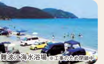
難波江海水浴場 ※工事のため閉鎖中