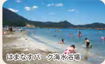
はまなかパーク海水浴場