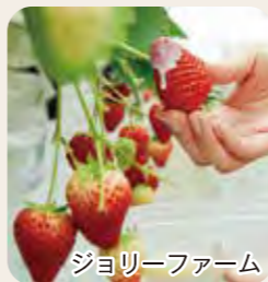
ジョリーファーム