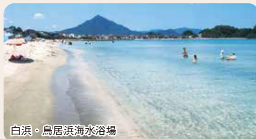
白浜・鳥居浜海水浴場

町内に8つの海水浴場があり、それぞれに特徴があります。賑やかな休日もいですが、平日は人が少なくゆったり楽しんでいただけます。