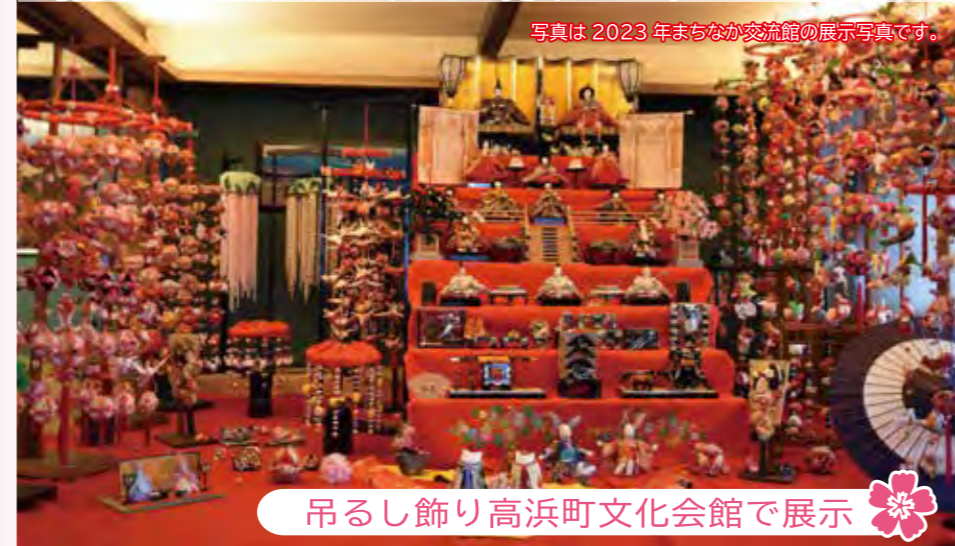
写真は2023年まちなか交流館の展示写真です。

69軒の家々に、代々伝わるひな人形が眠りから目覚める…。 町内を散策がてらゆっくりとご覧ください。