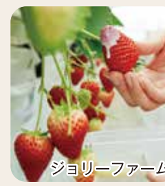
ジョリーファーム