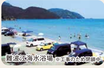
難波江海水浴場 ※工事のため閉鎖中