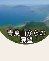
青葉山からの展望

青葉山(標高693m)は、美しい景観や、豊かな植物を鑑賞しながら、登山初心者から楽しめる山です。