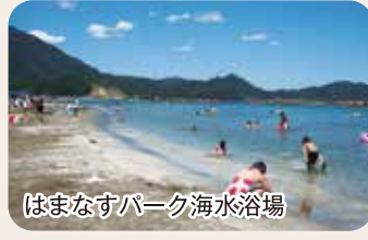
はまなすパーク海水浴場