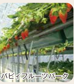
ハビフルフルーツパーク