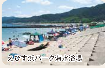
えびす浜パーク海水浴場