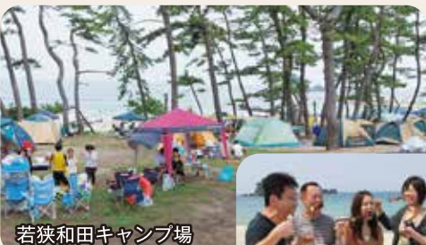
若狭和田キャンプ場

海水浴期間中、浜辺でBBQができる場所や施設があり人気です。地どりの新鮮シーフードがおすすめ。また、高浜町のキャンプ場は、いずれも海辺にあり、色んな遊びが楽しめます。夏季以外も営業しているキャンプ場もありシーズンオフも楽しめます。