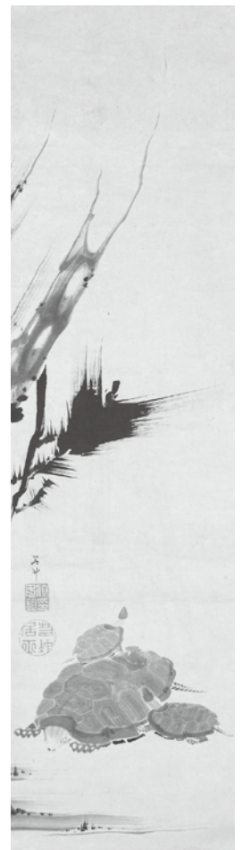
紙本墨画 松亀図 伊藤若冲筆 (大光明寺 蔵)