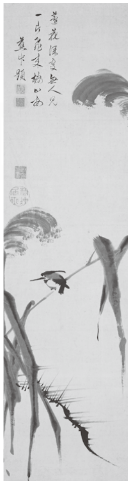
紙本墨画 蘆花翡翠図 梅荘頭常賛 伊藤若冲筆 (大光明寺 蔵)

相国寺と園松寺との関係についても知っているいただき、禅宗文化の交流を身近に感じてもらいたい。