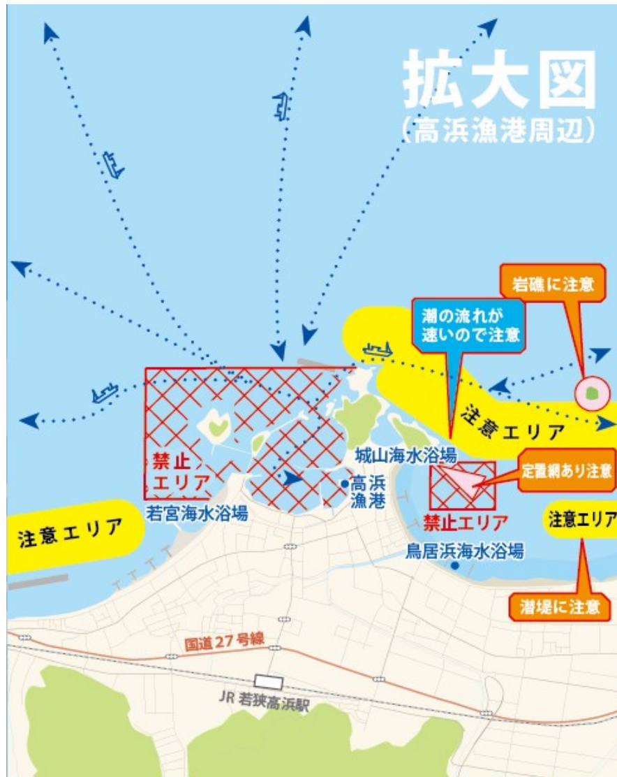
②拡大図（高浜漁港周辺）