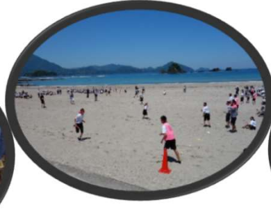
ビーチスポーツで遊ぼう